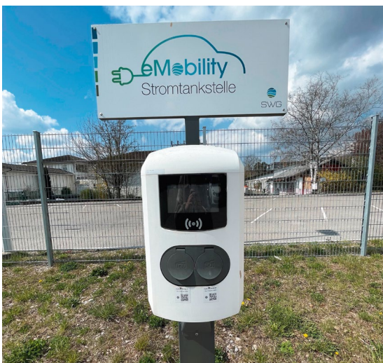
Freistehende Ladesäule inklusive einer Wallbox mit zwei Ladepunkten

In der Praxis werden bei Firmen (Firmenflotten, Mitarbeiter) und Privaten (EFH, MFH) üblicherweise Wallboxen eingesetzt, weil diese eine einfache und kostengünstige Installation zulassen. Ladesäulen werden hauptsächlich im öffentlichen Ladenetz verwendet oder wenn eine Wandmontage nicht möglich ist.